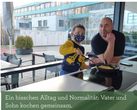
Ein bisschen Alltag und Normalität: Vater und Sohn kochen gemeinsam.