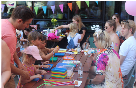
Sommerfest 2025: Kunterbunter Bastelspaß mit unseren ehrenamtlichen Kolleginnen.