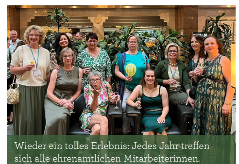
Wieder ein tolles Erlebnis: Jedes Jahr treffen sich alle ehrenamtlichen Mitarbeiterinnen.