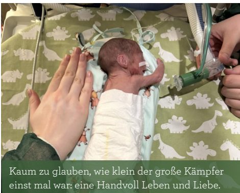
Kaum zu glauben, wie klein der große Kämpfer einst mal war: eine Handvoll Leben und Liebe.

In dieser Zeit hatte ich das Glück, dass ich im Ronald McDonald Haus, nur wenige Schritte von der Intensivstation der