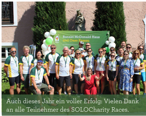
Auch dieses Jahr ein voller Erfolg: Vielen Dank an alle Teilnehmer des SOLOCharity Races.

alles zu geben, sodass es ihnen in der Zeit, in der sie bei uns wohnen oder die Wartezeit verbringen, an nichts fehlt.