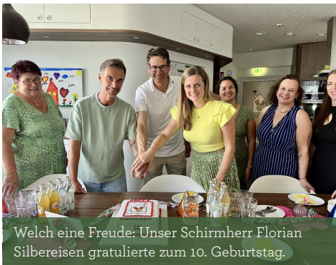
Welch eine Freude: Unser Schirmherr Florian Silbereisen gratulierte zum 10. Geburtstag.

Genau diese Erlebnisse haben uns bestärkt, auch weiterhin für unsere Familien