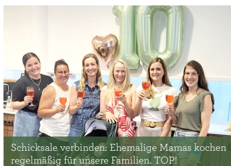
Schicksale verbinden: Ehemalige Mamas kochen regelmäßig für unsere Familien. TOP!