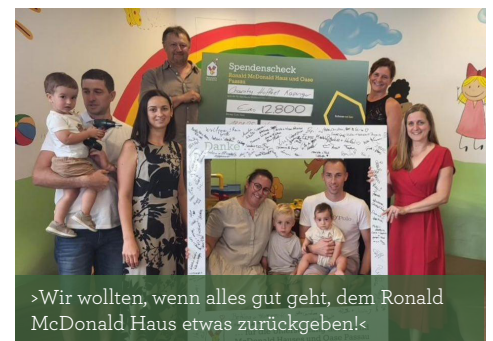
>Wir wollten, wenn alles gut geht, dem Ronald McDonald Haus etwas zurückgeben!<