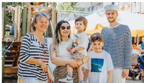
Besonders schön ist immer das Wiedersehen mit den ehemaligen Familien unseres Hauses.