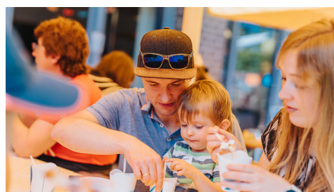
Natürlich durften auch Kuchen, Eis und Donuts bei unserem Fest nicht fehlen.

Unser diesjähriges Sommerfest feierten wir unter dem maritimen Motto >Schiff ahoi<. Neben verschiedenen Spielen und kulinarischen Angeboten veranstalteten wir mit den Kindern dabei eine abenteuerliche Schiffsreise, die unser Spielschiff im Garten in einen schweren Sturm brachte. Der Lübecker Shanty-Chor >Möwenschiet< sorgte zudem für die richtige Atmosphäre. •