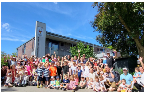
Ein Garten voller Zwillinge: So sah es bei uns am 29. Juni 2025 aus.

kennnisse aus der Zwillingsforschung teilen zu können. Mit einem Infostand blieben die beiden Wissenschaftlerinnen das Treffen über ansprechbar.