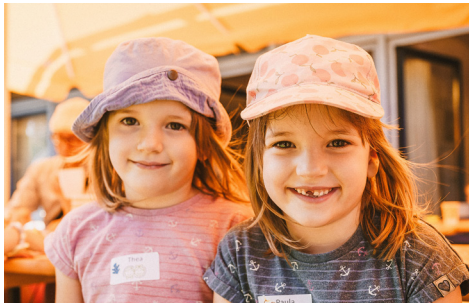
Viele der teilnehmenden Zwillinge wohnten in den Jahren davor in unserem Haus.