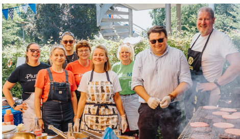
Das Grillteam der Deutschen Bank servierte den ganzen Tag leckere Burger.