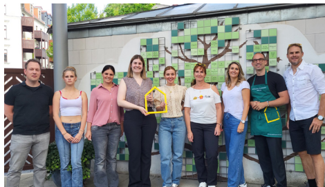
Ein leckeres Verwöhn-Abendessen, gekocht von Diversey und McDonald's Franchise-Nehmern.