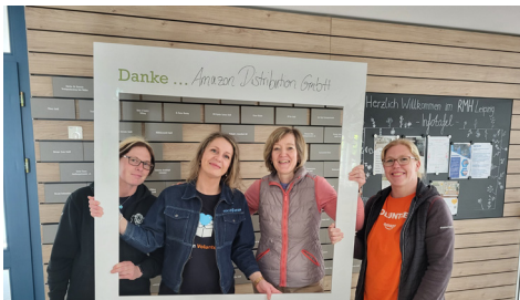
Ganze fünf Male kam Amazon Distribution in diesem Jahr zu uns ins Ronald McDonald Haus.