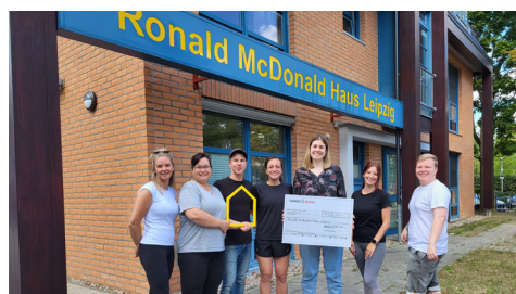
Die Targobank brachte zusätzlich zu ihrer Zeit auch noch eine tolle Spende über 2.000 Euro mit.

Auch in diesem Jahr hatten wir viele fleißige HelferInnen im Haus. Vielen Dank an: Amazon Distribution GmbH, Diversey Deutschland GmbH & Co. oHG, Schnellecke Transportlogistik GmbH, Schaeffler Vehicle Lifetime Solutions Germany GmbH & Co. KG, SoftwareONE Deutschland GmbH, Targobank AG und unsere Franchise-NehmerInnen von McDonald's Deutschland! •