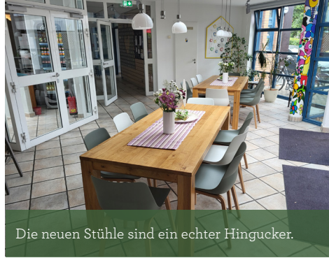
Die neuen Stühle sind ein echter Hingucker.

Im Foyer wurde außerdem eine neue Wünschetafel montiert, auf der nun