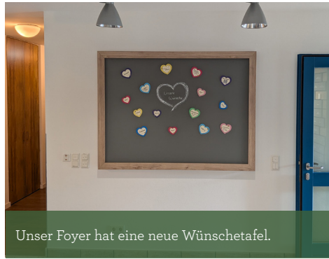
Unser Foyer hat eine neue Wünschetafel.

unsere aktuellen kleinen und großen Wünsche zu finden sind. Der betroffenen Wand wurde im Vorfeld ein frischer Anstrich verpasst, damit die Tafel richtig zur Geltung kommen kann.