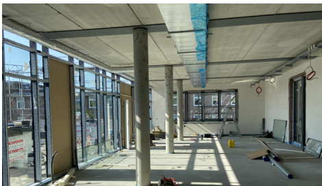
Der neue Gemeinschaftsbereich zum Kochen und Essen wird lichtdurchflutet und einladend.