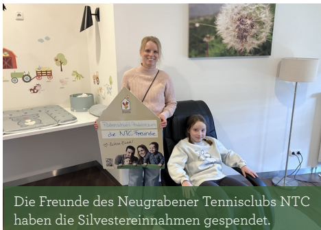
Die Freunde des Neugrabener Tennisclubs NTC haben die Silvestereinnahmen gespendet.