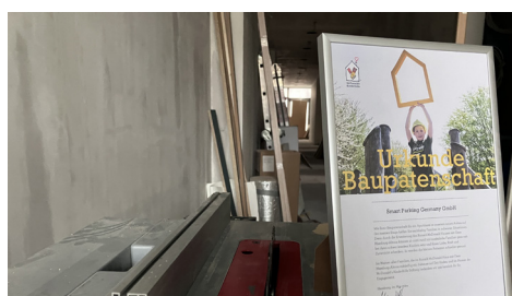
Smart Parking Germany GmbH ist ebenfalls Baupate eines neuen Apartments