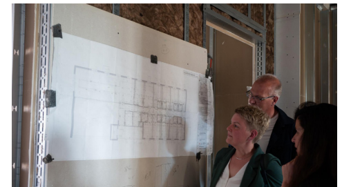
Großes Interesse an der Baustellenentwicklung besteht auch bei den Unterstützern des Hauses.