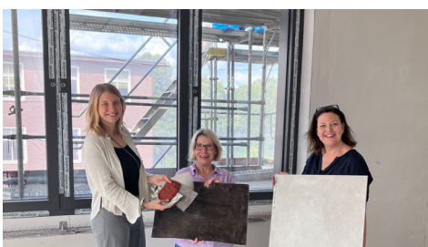
Das Team freut sich über die ersten Muster der Inneneinrichtung des Gemeinschaftsbereichs.

frage ist daher groß. Zusammen mit dem Altonaer Kinderkrankenhaus ging es Stück für Stück >hoch hinaus<. Ein großer Dank geht an die vielen Förderer, Spender und Bau-Paten, die uns dabei unterstützt haben, dass aus einem kahlen Gebäude ein behagliches Zuhause werden konnte, das Schutz bietet wie ein fertiges Dach, Zuversicht bringt wie die eingesetzten Fenster und ein Herz hat: