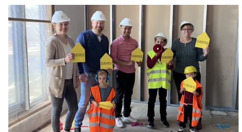
Familien des Hauses sagen DANKE an alle Spender, die den Anbau unterstützen.

frage ist daher groß. Zusammen mit dem Altonaer Kinderkrankenhaus ging es Stück für Stück >hoch hinaus<. Ein großer Dank geht an die vielen Förderer, Spender und Bau-Paten, die uns dabei unterstützt haben, dass aus einem kahlen Gebäude ein behagliches Zuhause werden konnte, das Schutz bietet wie ein fertiges Dach, Zuversicht bringt wie die eingesetzten Fenster und ein Herz hat: