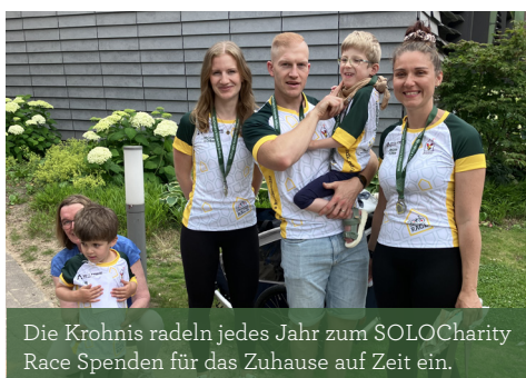
Die Krohnis radeln jedes Jahr zum SOLOCharity Race Spenden für das Zuhause auf Zeit ein.

Viele Familien, die das Elternhaus schon in Anspruch nehmen mussten, werden zu Botschaftern. Sei es, die Spendenaktion >Spenden statt Schenken< zu besonderen Anlässen ins Leben zu rufen, bei Arbeitgebern, Vereinen sowie Schulen über das Zuhause auf Zeit zu berichten und einen Social Day gemeinsam durchzuführen oder eine Weihnachtsspende zu tätigen. Jede Idee hilft dem Elternhaus! •