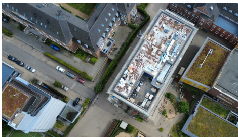
750 m 2 Fläche für die neue Etage – gut erkennbar die große Außenterrasse in der rechten Ecke.

Ab 2026 können die Familien dann in die obere Etage einziehen und auf der Außenterrasse kräftig Luft holen, bevor sie wieder in die Sorgen eintauchen. •