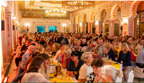
Rund 400 ehrenamtliche Mitarbeiterinnen und Mitarbeiter kamen in Hannover zusammen.

Unter dem Motto >Zusammen wachsen in Niedersachsen< lud die McDonald's Kinderhilfe Stiftung dieses Jahr zur Sternfahrt nach Hannover ein. Rund 400 ehrenamtliche Mitarbeiterinnen und Mitarbeiter aus ganz Deutschland erlebten gemeinsam ein inspirierendes Fortbildungs- und Begegnungswochenende mit einzigartigem Teamspirit.