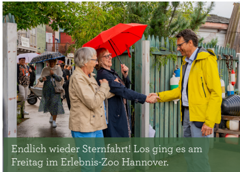
Endlich wieder Sternfahrt! Los ging es am Freitag im Erlebnis-Zoo Hannover.

Fachlicher Austausch und Gemeinschaft standen im Mittelpunkt: Von Erste Hilfe bis Kommunikation – Teamgeist wurde gestärkt und Wissen geteilt. >Die Sternfahrt ist für uns eine Gelegenheit des Innehaltens, des gemeinsamen Wachstums