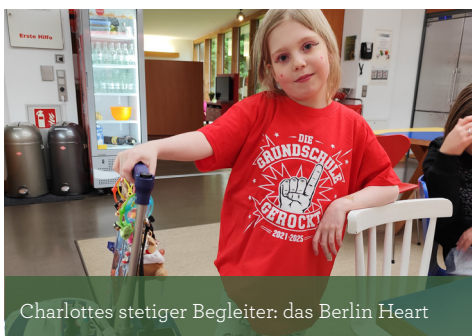
Charlottes steter Begleiter: das Berlin Heart