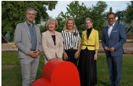
Jahresempfang mit dem traditionellen Spargelessen von Spargelhof Winkelmann

Vielen Dank an unser Ehrenamtsteam und die Mitarbeitenden der Klinik für die gute Zusammenarbeit und Unter-