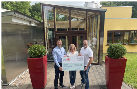
Vielen Dank für die treue Unterstützung des Business Clubs Bad Oeynhausen!

stützung! Wir sind überwältigt von so viel Engagement und Herz für unser Ronald McDonald Haus. Jeder einzelne Beitrag – ob durch einen Volunteering Day, gemeinsame Kochabende oder auch durch große Aktionen und Veranstaltungen zu unseren Gunsten – macht unser Zuhause auf Zeit zu einem Ort voller Wärme, Geborgenheit und Zusammenhalt. Herzlichen Dank! •