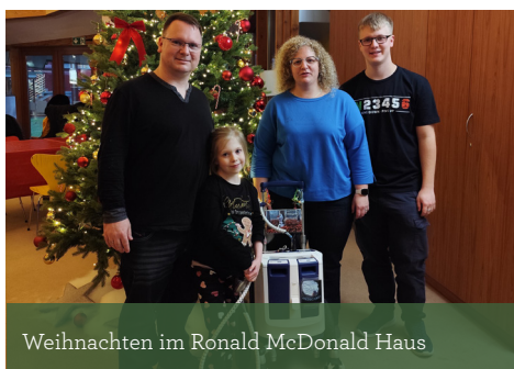
Weihnachten im Ronald McDonald Haus