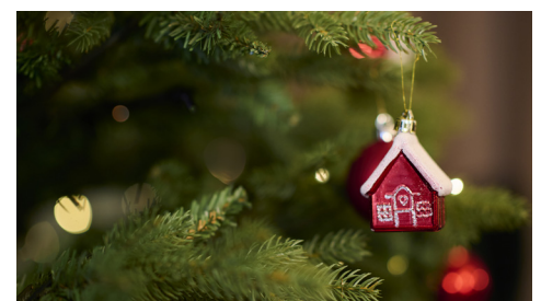
Wir wünschen eine schöne Weihnachtszeit!

Mit Dankbarkeit blicken wir auf ein bewegendes Jahr zurück und sind voller Vorfreude auf all die schönen Momente, die noch vor uns liegen – besonders auf unser großes Jubiläum 2026, wenn wir gemeinsam 25 Jahre voller Nähe, Herzenswärme und unvergesslicher Begegnungen miteinander teilen und feiern dürfen. •