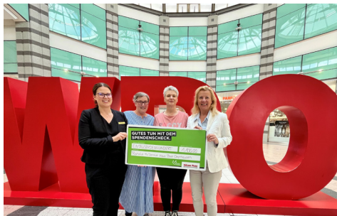
Das Team von Woolhouse Nicola Sieker und der Werre-Park unterstützen uns seit Jahren. Danke!