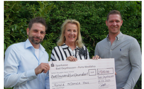
Wertvolle Unterstützung durch die Bali Therme. Vielen Dank!